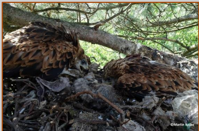
Besenderte Rotmilane aus Mahndorf im Nest 2020.

Wir sind gespannt, wie sich die Jungvögel weiterentwickeln und wohin ihre Reisen noch gehen werden!